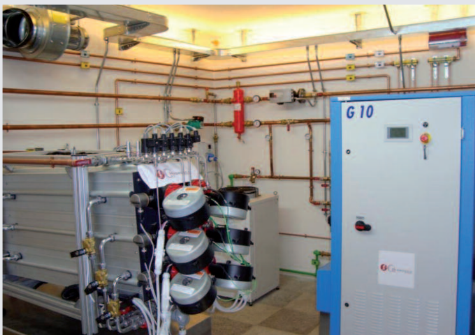
Generatore di H 2 Erreuegas G10 da 6,7 Nm 3 /h, per alimentazione caldaia a idrogeno per riscaldamento strutture alberghiere con fonti rinnovabili

Dal punto di vista dell'attività industriale, in Italia, a parte il già citato Gruppo De Nora, non esistono grandi industrie produttrici di elettrolizzatori. È presente però una realtà costituita da piccole società che producono generalmente elettrolizzatori di tipo alcalino, sia a pressione atmosferica che ad alta pressione, ed elettrolizzatori a membrana.