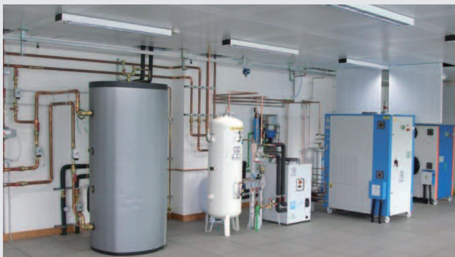
Laboratorio Giacomini SpA: impianto dimostrativo di caldaia a idrogeno con produzione di idrogeno per via elettrolitica con sorgenti energetiche rinnovabili

Alla luce di quanto finora riportato, l'elettrolisi dell'acqua rappresenta una tecnologia ben consolidata dal punto di vista tecnico ed in grado di fornire consistenti quantità di idrogeno ed ossigeno ad impatto ambientale praticamente nullo. Tuttavia, l'impedimento principale per una più ampia diffusione è senz'altro rappresentato dal costo attuale dell'energia elettrica. In tal senso, un'interessante prospettiva può essere individuata nel