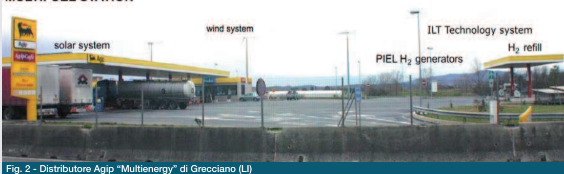
Fig. 2 - Distributore Agip "Multienergy" di Grecciano (LI)

In particolare, nella provincia di Milano, sono attive la Sepsi Srl, la Nitor Clever Srl che produce sistemi fino a 30 bar con produzione di idrogeno da 0,25 a 2,0 Nm 3 /h e che collabora con la Casale Chemicals (CH), la Idrogen2 con impianti ad alta pressione (30 bar) che forniscono fino a 5 Nm 3 /h di idrogeno.